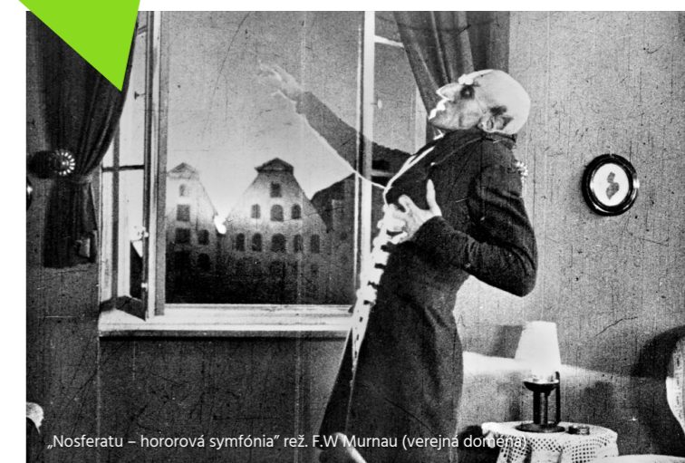
„Nosferatu – hororová symfónia“ rež. F.W. Murnau

Nosferatu – hororová symfónia z roku 1922 režiséra Friedricha Wilhelma Murnaua je najstarším filmom produkovaným v oblasti poľsko-slovenského pohraničia. Ide o prvý významný horor v histórii kín a súčasne archetyp nespočetných ďalších upírskych príbehov. Fotografie k filmu vznikali o. i. v Žilinskom kraji na Slovensku.