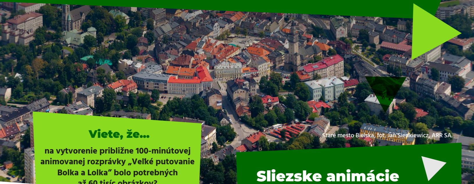
Staré mesto Bielská, fot. Jan Sienkiewicz, ARR SA.