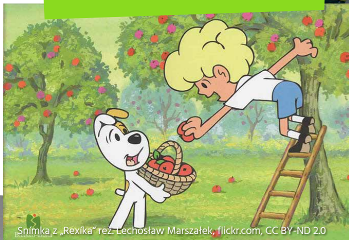
„Snímka z „Rexíka“ rez. Lechosław Marszałek, flickr.com, CC BY-ND 2.0

na vytvorenie približne 100-minútovej animovanej rozprávky „Velké putovanie Bolka a Lolka“ bolo potrebných až 60 tisíc obrázkov?