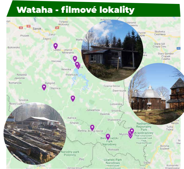
Marina Komandor v Soline, Chata Rebrowa, Priehrada v Soline, Tarnawa Niżna - základňa nad Roztokami, Bóbrka pri Soline - Iom Rabe - kameňolom "Gruby", Ustrzyki Górne - budova jednotky pohraničnej stráže Bieszczady, parkovisko a hostinec na priechode Wyżna v Brzegach Górnych, prírodná rezervácia "Sine wiry", Huzele - most cez rieku San